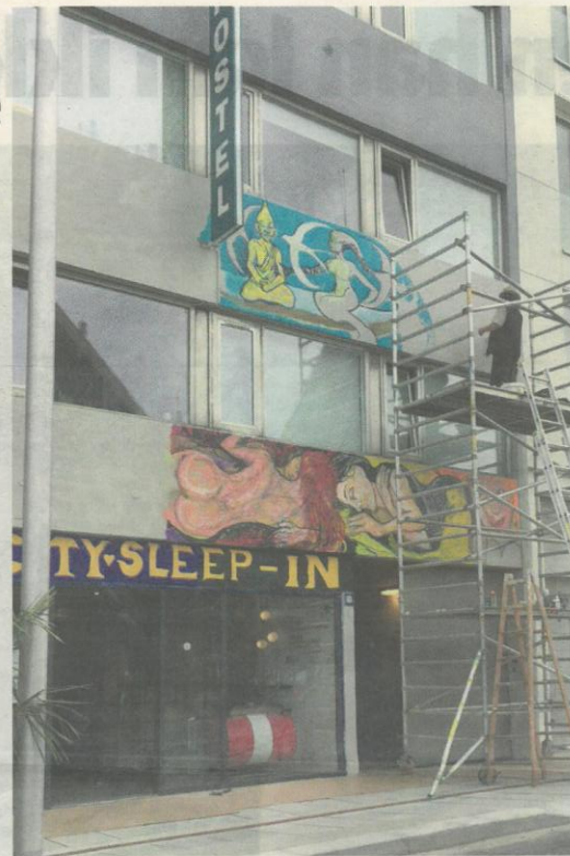
Havfruer, guder og frodige kvinder optræder på facaden. På torsdag står værket klar.

Aarhus-kunstneren og hans hustru udsmykker tidligere sømandshjem i Havnegade.